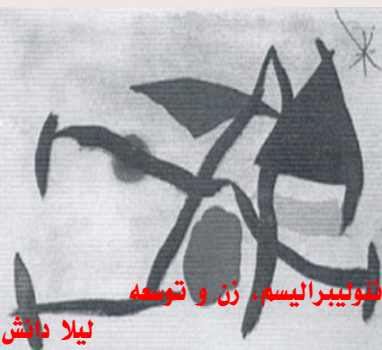
فولبیرالیسم، زن و توسعه نیلا دانش