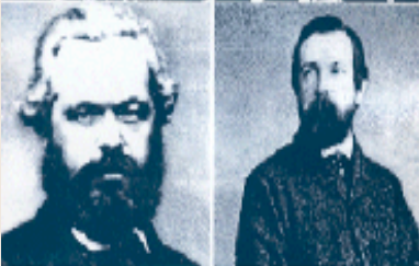
اتحادیه‌ها کمونیست‌ها مارکس و انگلس - مقدمه‌ی: جعفر رسا