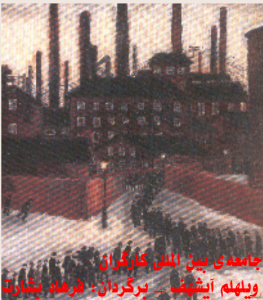
جامعه‌ی بین المللی کارگران ویلهلم آیشرف - برگردان: فرهاد پشاورا

کتاب‌های زیر را می‌توانید در سایت «نگاه»، لینک «کتاب» بخوانید: